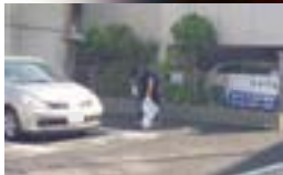
弊社による清掃活動