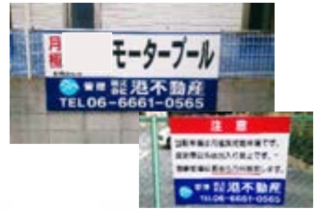
弊社管理看板の設置